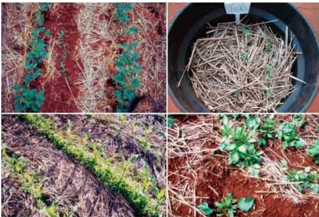
Figura 1. Falhas em sistemas de plantio direto na supressão da cobertura na superfície do solo, ou na incapacidade de superação de algumas espécies de plantas daninhas em relação à palhada.

Mais especificamente, com relação ao controle de plantas daninhas, temos os benefícios das coberturas mortas em relação às alterações das comunidades infestantes têm sido atribuídos aos possíveis efeitos de compostos alelopáticos, constituídos por substâncias lavadas da palhada para o solo através da água das chuvas, e que dependem diretamente de processos de decomposição e atividade microbiológica do solo. Além disso, os efeitos físicos da cobertura morta ao cobrir a superfície do solo não podem ser desconsiderados, uma vez que as infestantes, em geral, apresentam dormência ou algum tipo de controle de germinação. Nos diferentes sistemas de plantio direto podem ocorrer variações na quantidade e composição da palhada, proporcionando situações de elevada desuniformidade e falhas na cobertura da superfície do solo, onde os espaços vazios sem palha certamente não suprimirão a formação da comunidade infestante em reboleiras (Figura 1).