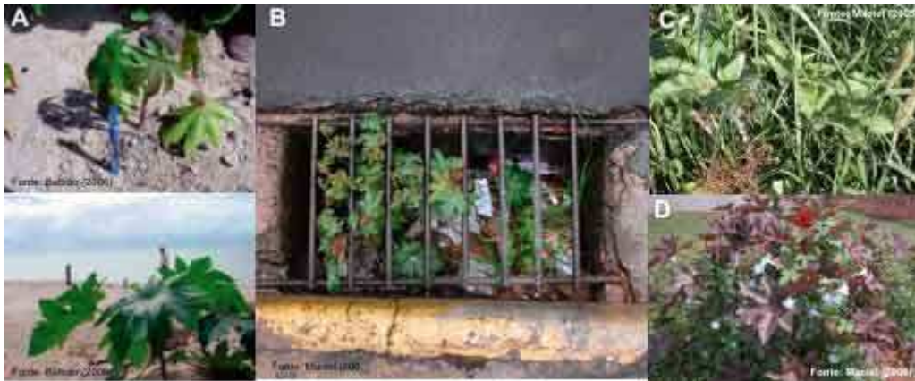
Figura 2. Exemplos de plantas de mamona se desenvolvendo e até mesmo produzindo em condições restritas de sobrevivência. (A) solo salino de praia; (B) bueiro de rua; (C) competição com outras espécies na forma cultivada ou (D) em terreno baldio.

A mamoneira é tradicionalmente considerada como planta daninha em várias culturas, onde como infestante, suas folhas grande pode sombrear diferentes espécies cultivadas, ocasionando perdas de produtividade. Do ponto de vista fisiológico, por apresentar eficiência fotossintética relativamente baixa (metabolismo C3), a mamoneira pode ser qualificada como espécie de alta sensibilidade à competição com plantas daninhas por água, luz e nutrientes. Entretanto, são quase inexistentes informações recentes envolvendo recomendações de cultivares e a definição do período crítico de competição da infestação nas diferentes regiões produtoras do país. A informação mais difundida sobre a espécie é de sua "alta capacidade de sobrevivência em terrenos baldios" (Figura 2).