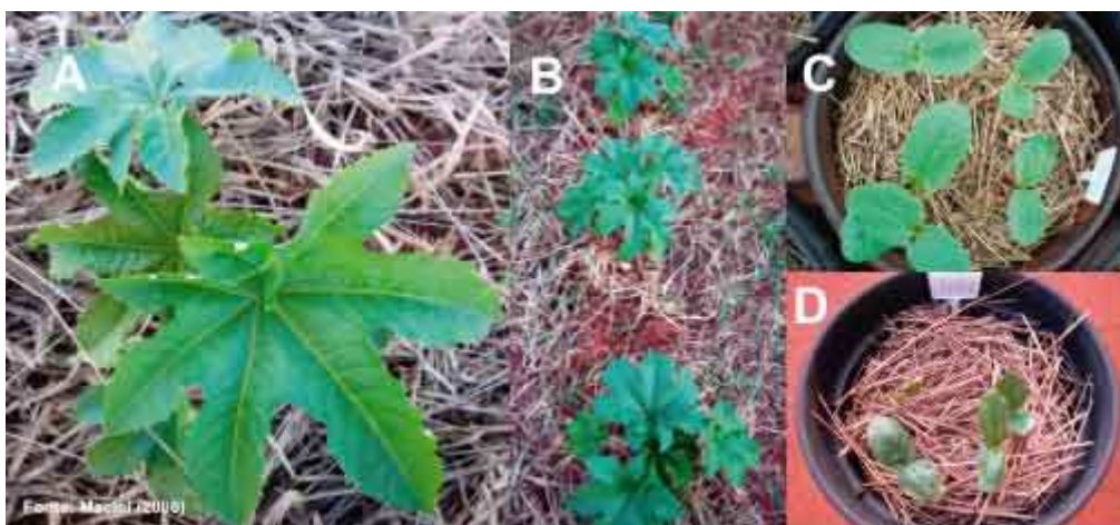
Figura 5. Sistema de semeadura direta da mamoneira cv. Iris em coberturas mortas formadas por capim-braquiária (A e B) e infestação natural de plantas daninhas (C) e mamoneira cv. AL Guarany 2002 em palhada da cultura do trigo (D). ESAPP/Paraguaçu Paulista-SP, 2003/2004.

braquiária ( Brachiaria decumbens ), trigo e cana-de-açúcar na Escola Superior de Agronomia de Paraguaçu Paulista/SP (FUNGE/ESAPP) têm apresentado comportamentos favoráveis, não havendo impedimento do desenvolvimento da mamoneira (Figura 5).