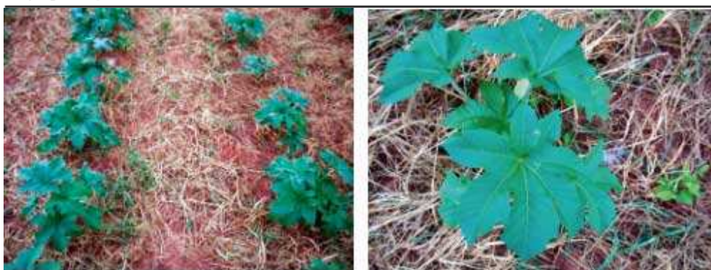
Figura 4. Exemplo de estágio fenológico máximo das plantas de mamoneira, não devendo ser inferior a 4-5 folhas e/ou ultrapassar 7-8 folhas, para aplicação complementar de chlorimuron-ethyl em pós-emergência da cultura no sistema de semeadura direta. ESAPP/Paraguaçu Paulista-SP, 2004/2005.

Outro aspecto ainda a ser considerado em relação à falta de herbicidas latifolicidas seletivos para mamoneira, é o lado positivo de poder desmistificar uma preocupação constante dos agricultores na adoção receosa da cultura da mamona como lavoura de sucessão, sem criar problemas de posterior infestação da área após colheita. Estas lembranças negativas são reflexos da implantação de culturas em sucessão na resteva da mamona, onde as operações de preparo do solo proporcionavam o enterramento das sementes não colhidas em diferentes profundidades, dificultando a eficiência do controle químico. No sistema de semeadura direta, o não revolvimento do solo facilita o controle químico da resteva da mamona, devido a maior exposição das sementes na superfície do solo e da elevada sensibilidade a vários herbicidas. Exemplos típicos da situação facilitada para a sucessão de culturas como milho na resteva da mamona, onde qualquer herbicida a base de atrazine (Primestra®, Herbimix®, Atrazinax®, Boxer®, Siptran®, etc...), nicosulfuron (Sanson®), metolachlor (Dual®), isoxaflutole (Provence®) entre outros, assim como para soja teríamos imazethapyr (Pivot®, Vezir®), cloransulan (Pacto®), lactofen (Cobra®, Naja®), fomesafen (Flex®), bentazon (Basagran®), fumiclorac-pentyl (Radiant®), sulfentrazone (Boral®), diclosulan (Spider®), flumetsulan (Scorpion®), metribuzin (Sencor®), sendo extremamente prejudiciais à mamoneira.